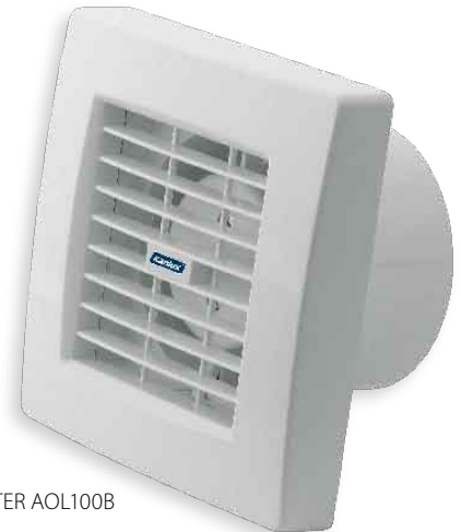
■ TWISTER AOL100B