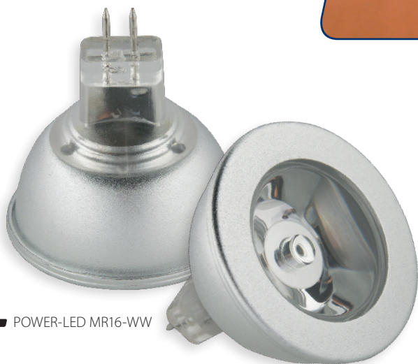
■ POWER-LED MR16-WW