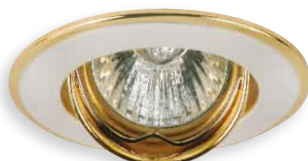
■ PARLE CTC-5519-PS/G