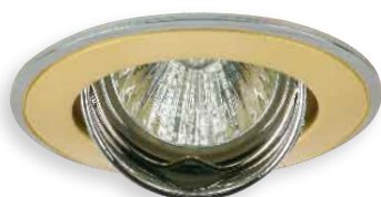
■ PARLE CTC-5519-PG/N