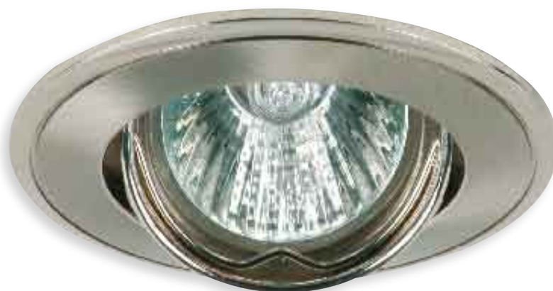
■ PARLE CTC-5519-MPC/N