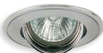
■ PARLE CTC-5519-SN/N