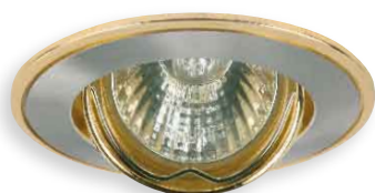
■ PARLE CTC-5519-SN/G