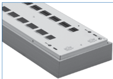
VRCHNÍ STRANA SVÍTIDLA EXA228KO