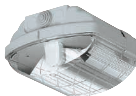
Provedení svítidla s reflektorem hlubokozářič

Svítlidla lze použít ve venkovních krytých zónách.