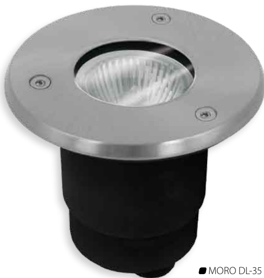
■ MORO DL-35