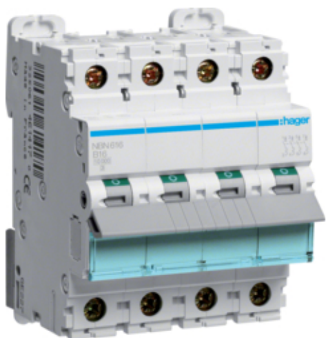
Jistič 3+N pól. 16A, char.B, 10 kA